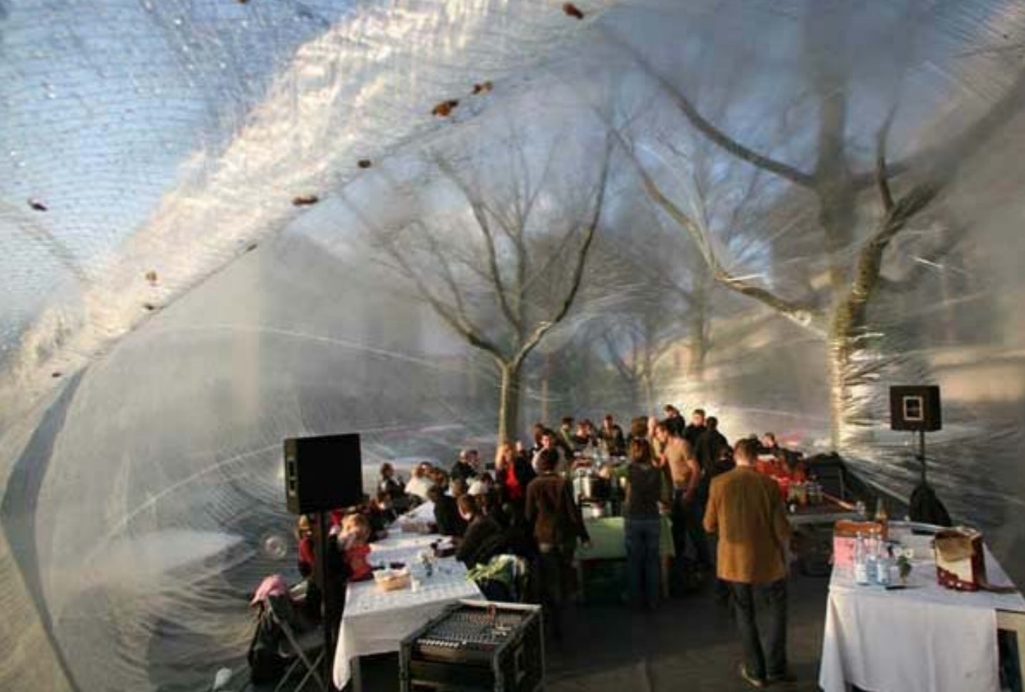
Das „Küchenmonument“, eine aufblasbare Plastikhülle, diente schon an den absurdesten Plätzen als Veranstaltungsort