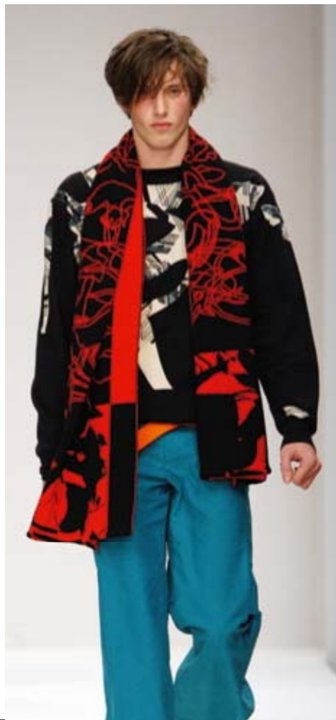
Im Februar 2006 zeigten C.Neeon ihre Kollektion „haschmichmädchen“ in London, oben Modell „Kickout“ unten „Dan“