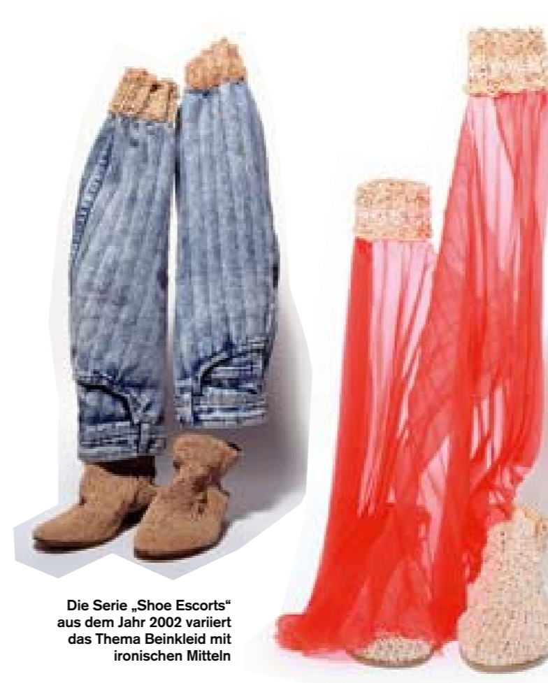
Die Serie „Shoe Escorts“ aus dem Jahr 2002 variiert das Thema Beinkleid mit ironischen Mitteln

RAUMLABOR Raum ist viel mehr als Wände, Fenster, Treppen und Türen. Das beweist das Planerkollektiv Raumlabor spätestens seit der berühmten „Fassadenrepublik“. Für das weltweit beachtete Festival im leer stehenden Palast der Republik 2004 setzten sie das Gebäude unter Wasser und ließen die Gäste mit Schlauchbooten zu den einzelnen Kunstpavillons paddeln. Später installierten sie an gleicher Stelle einen großen Berg als begehbare Ausstellungsarchitektur. Und für wechselnde Orte bieten sie ihr aufblasbares „Küchenmonument“ als Lokalität an – etwa als „Ballsaal Ruhrperle“ in Mülheim oder als Versammlungssaal unter eine Straßenbrücke gequetscht. Mit ihren „irrationalen Objekten“ zeigt die Gruppe immer wieder, wie andere Räume auch zu einem anderem Verhalten führen. Internet: www.raumlabor-berlin.de