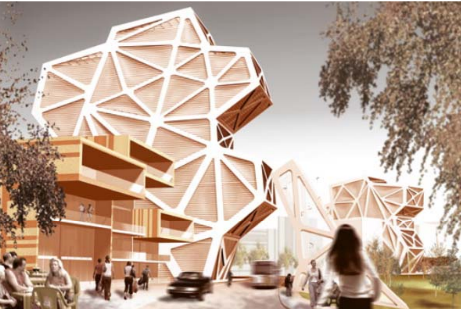
Hotels, Büros und Wohnungen beinhaltet Jürgen Mayer H.s Projekt „Twins“ im belgischen Ort Hasselt, das 2009 fertiggestellt wird

Kommen die internationalen Künstler nach Berlin, um hier zu arbeiten, so erobern die Jungen Berliner Designer gerade die Welt. Modeschöpfer, Architekten, Illustratoren und Industriedesigner haben mit schrägen Ideen enormen Erfolg. Eine kleine Auswahl