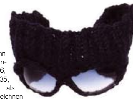
Eine Winterbrille mit Strickapplikation aus der Bless-Kollektion „Uniseasoners“ von 2005