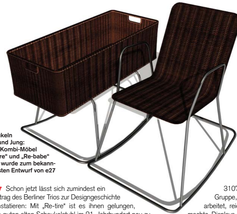
Schaukeln für Alt und Jung: Das Kombi-Möbel „Re-tire“ und „Re-babe“ (2001) wurde zum bekanntesten Entwurf von e27