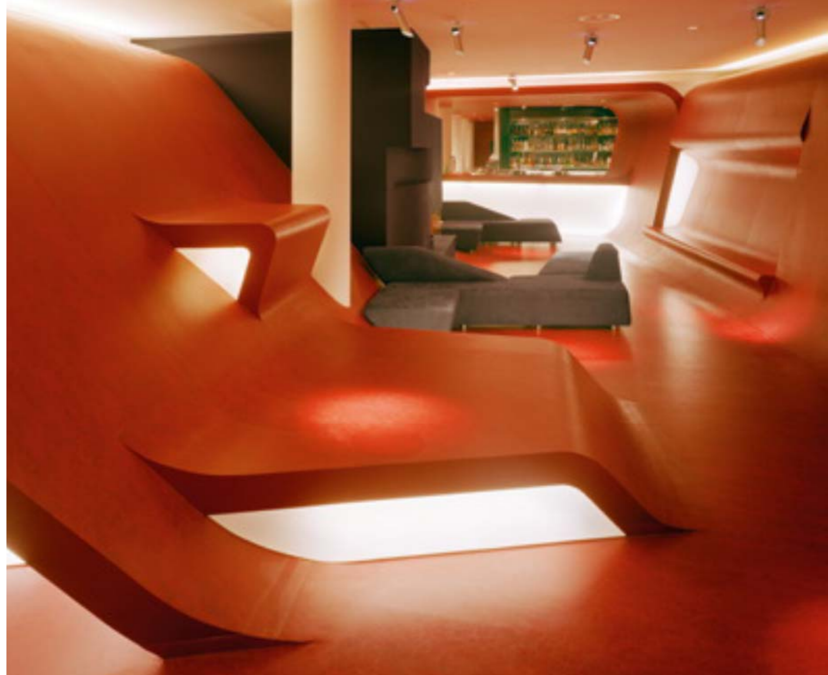
den extravagantesten Adressen in Berlin, die Zahnarztpraxis am Kurfürstendamm (unten) macht Bohren zum filmreifen Auftritt