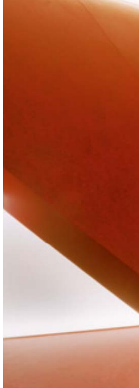
Das Designhotel Q! (oben) von Graft zählt zu