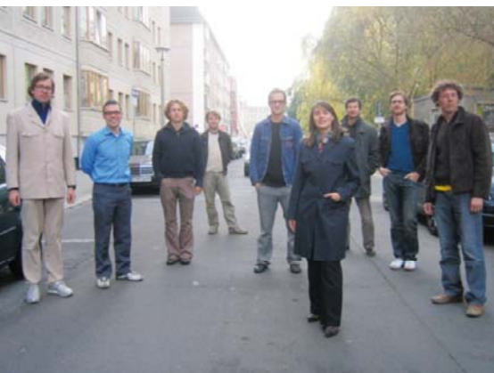
Das Kollektiv „Raumlabor“ begreift sich als ein offener „Wissens- und Ressourcenpool“. Für die einzelnen Aktionen wird mit verschiedenen Experten zusammengearbeitet