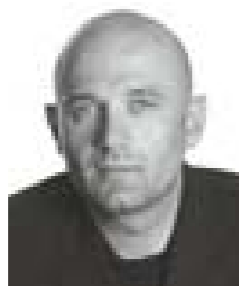
Jürgen Mayer H.

JÜRGEN MAYER H. Bevor der Architekt mit Mitte 30 sein erstes Gebäude fertigstellte, entwarf er Hausrat mit Witz: Bettwäsche mit Thermobeschichtung, auf der sich Schlafpositionen weiß abzeichnen, oder das Anti-Graffiti-Design für die Berliner S-Bahn. Doch seit er 2002 ein spektakuläres Stadthaus in Ostfildern bauen durfte, ist Jürgen Mayer H. (H. für Hermann), 40, weltberühmt. Seine Entwürfe wirken wie vergrößerte Designobjekte mit Hang zur barocken Skurrilität, sind aber funktional durchdacht. Eine pilzförmige Stadtlandschaft aus Holz, die er gerade im Zentrum von Sevilla baut, stapelt über einer archäologischen Fundstelle Markthalle, Stadtplatz und Aussichtsplattform. In Karlsruhe entsteht eine lichte Mensa in Form von zwei Brotscheiben, verbunden mit Honigfäden, in Dänemark ein Erlebnispark wie aus angebissenen Tortenstücken. Internet: www.jmayerh.de